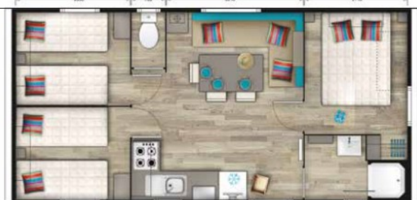
Plan du mobil home à titre indicatif

Plus d'informations au 05.46.76.69.07 ou par e-mail contact@campinglabouliniere.com