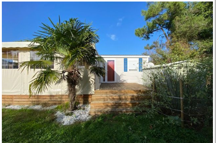
Solarium sans vis à vis, abri de jardin.