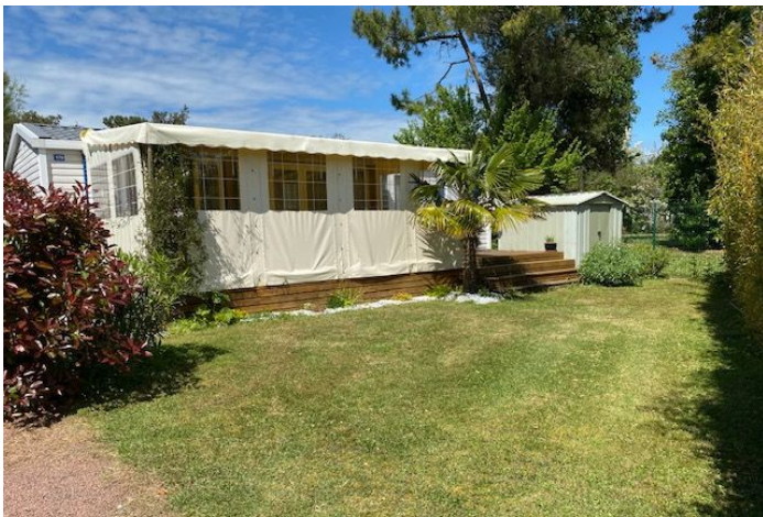
Parcelle 170 très spacieuse. Terrasse en bois de 3m x 9m couverte et fermée sur 6m soit 18m 2 .