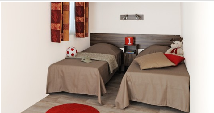
2 chambres enfant avec lits jumeaux (photo non contractuelle)