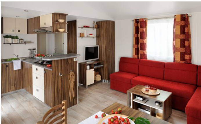
Belle pièce de vie avec cuisine panoramique donnant sur la terrasse équipée d'un lave-vaisselle. Espace repas séparé du salon. (photo non contractuelle)