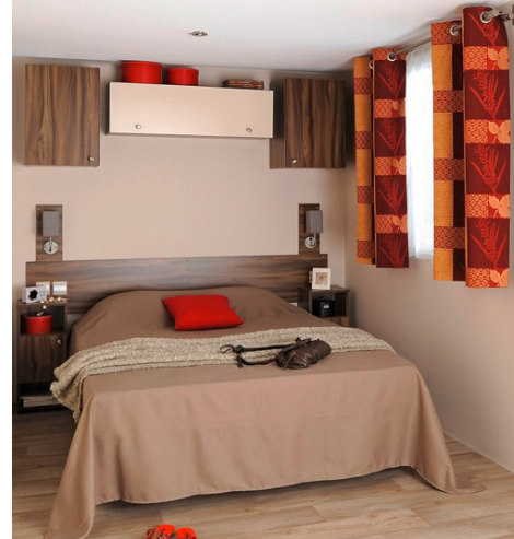
Chambre parentale avec salle de bain privative + WC (photo non contractuelle).