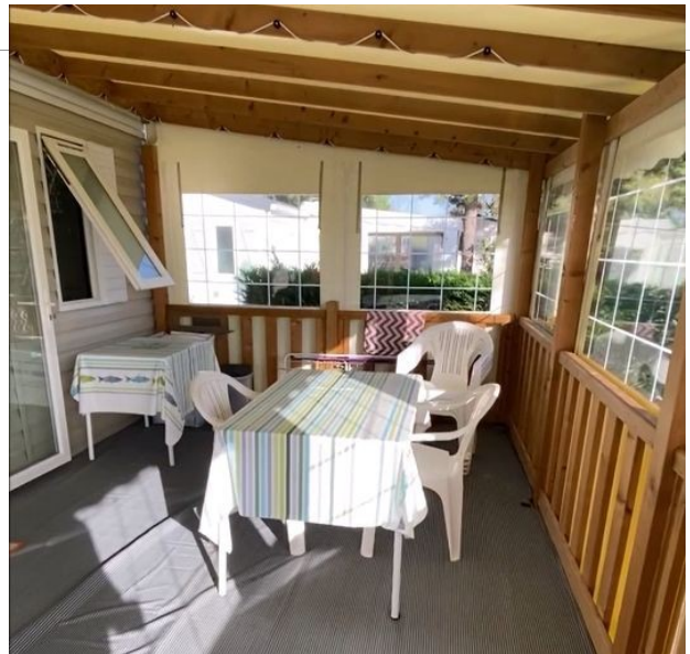
Terrasse 18 m 2 couverte et fermée