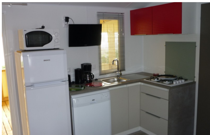
Cuisine toute équipée : lave vaisselle, frigo/congélateur, micro ondes, cafetière, grille pain, plancha, vaisselle, etc.