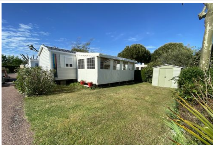
Parcelle 40. Terrasse couverte et fermée 18 m 2 . Abri de jardin et coffre gaz.