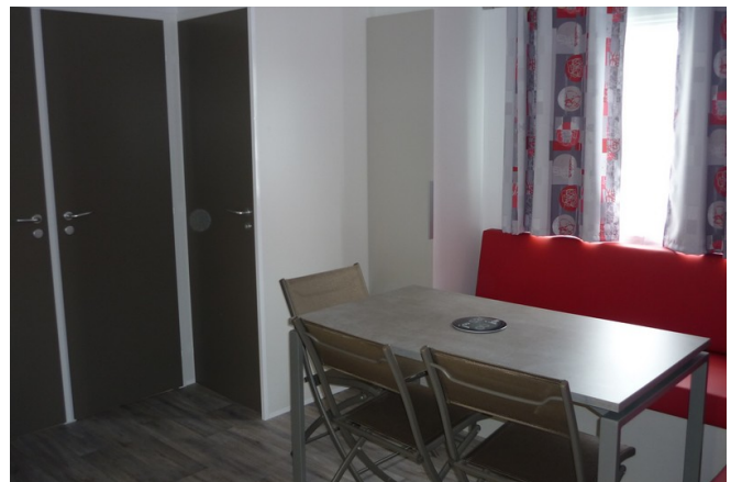
Espace repas / séjour. Banquette simili cuir rouge